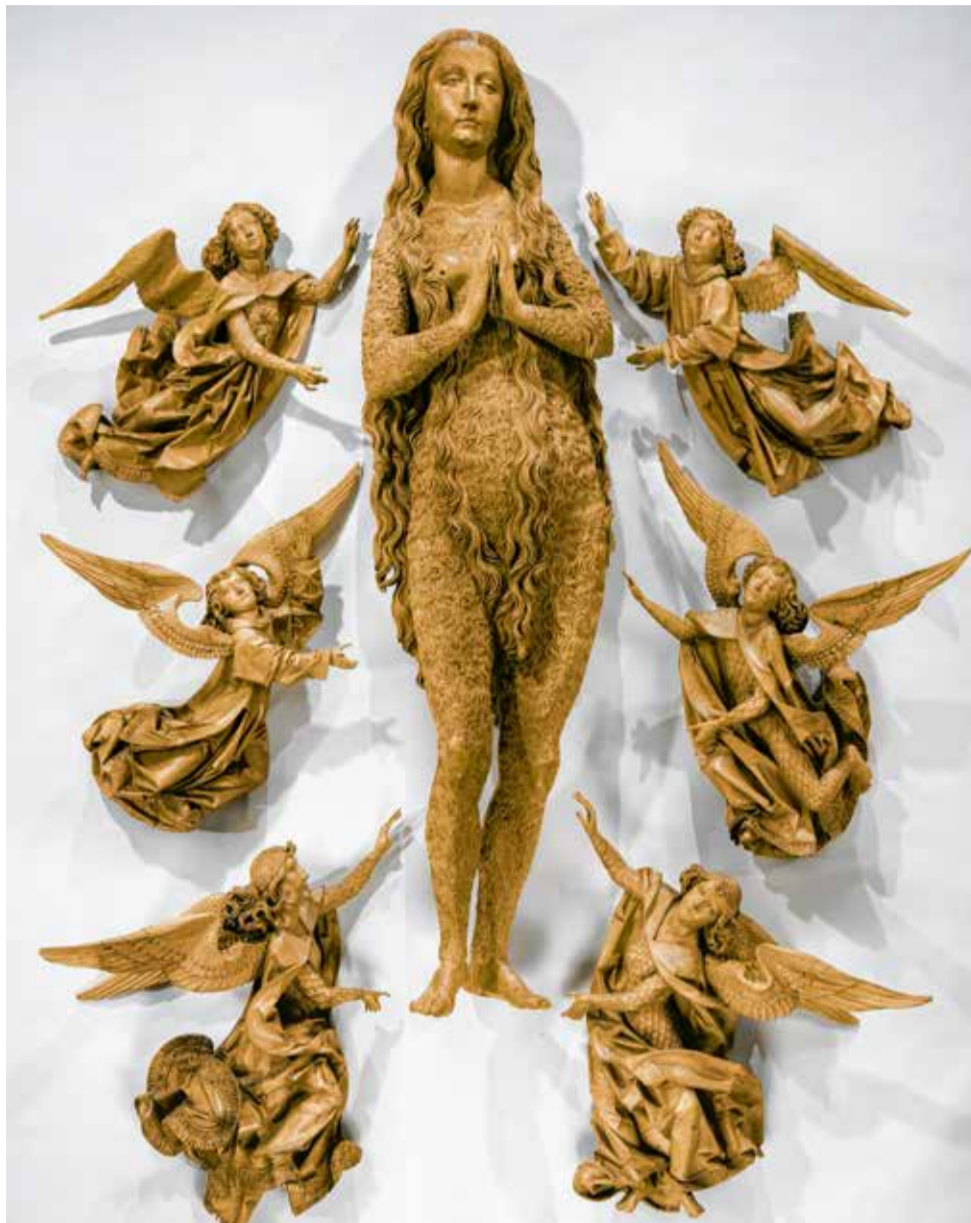
„Heilige Magdalena mit Engeln vom Hochaltar der St. Magdalenenkirche in Münsterstadt“, Würzburg, 1490/92, Lindenholz