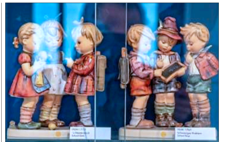
Betrieb eingestellt: Hummel-Figuren in einer Vitrine im Berta-Hummel-Museum in Massing.